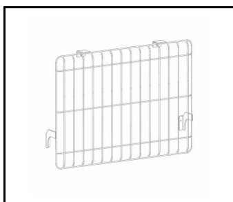
QUEST LED EVO M ochranná mřížka RAL9003 (840074)