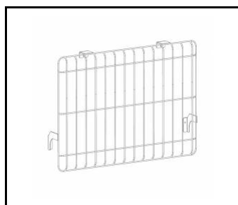
Grille de protection QUEST LED EVO M RAL7016 (840432)