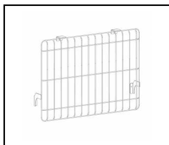
QUEST LED EVO M schutzgitter RAL7016 (840432)