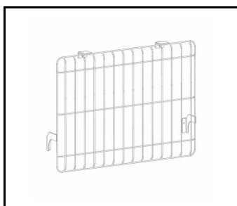
QUEST LED EVO M siatka ochronna RAL9003 (840074)