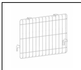
QUEST LED EVO M siatka ochronna RAL7016 (840432)