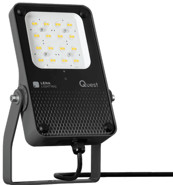
Zdjęcie poglądowe nie uwzględniające zawartych w zestawie uchwytów do montażu natynkowego. Overview photo not including the included surface-mount brackets.