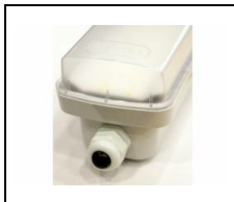
Bouchon presse-étoupe M16. divers PA noir M-16 - BPM-21 (60000006)

Date de création de la carte: 18 août 2025