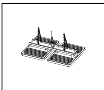
QUEST EVO EVEREST konektor svítidla - společné zavěšení RAL7016 (831751)