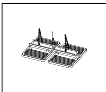
QUEST EVO EVEREST Leuchtenanschluss - gemeinsame Aufhängung RAL7016 (831751)