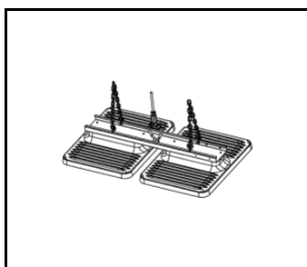
QUEST EVO EVEREST łącznik lamp- wspólne zwiesie RAL7016 (831751)