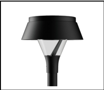
SKVER auvent ULR modèle 2 RAL9005 (421518)

Date de création de la carte: 22 juillet 2025 Le fabricant se réserve le droit d'apporter des modifications au cours de l'amélioration du produit ainsi que des modifications de conception ou de modernisation du produit présenté. La fiche technique du produit n'est pas une offre commerciale * La tolérance des paramètres est de +/- 10 %