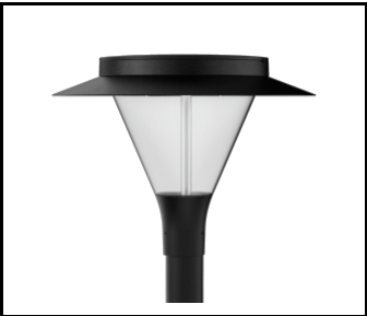
SKVER auvent. modèle 1 RAL9005 (435522)