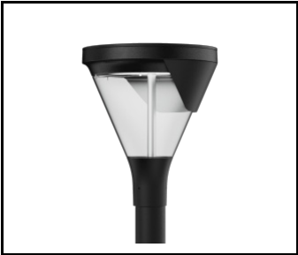
SKVER Backshield RAL9005 (435515)