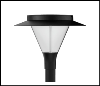
SKVER Reflektor Muster 1 RAL9005 (435522)