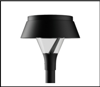
SKVER Reflektor ULR Muster 2 RAL9005 (421518)