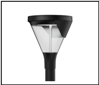
SKVER Backshield RAL9005 (435515)