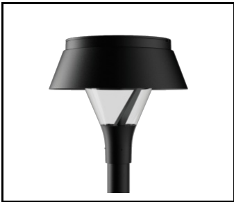
SKVER Reflektor ULR Muster 2 RAL9005 (421518)