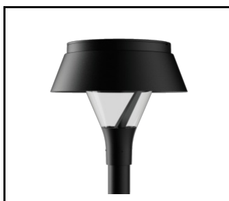
SKVER Daszek ULR wzór 2 RAL9005 (421518)