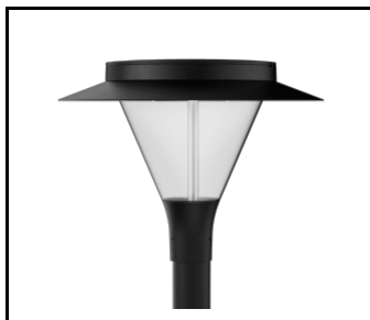
SKVER Hood příklad 1 RAL9005 (435522)