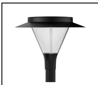
SKVER Reflektor Muster 1 RAL9005 (435522)