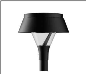
SKVER Reflektor ULR Muster 2 RAL9005 (421518)

Erstellungsdatum der Karte: 22 Juli 2025