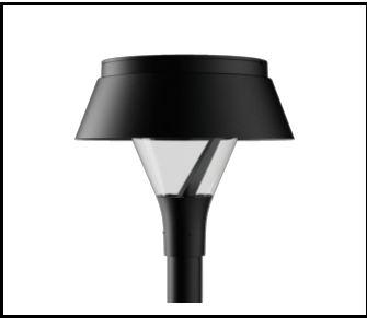
SKVER Reflektor ULR Muster 2 RAL9005 (421518)

Erstellungsdatum der Karte: 01 Dezember 2025