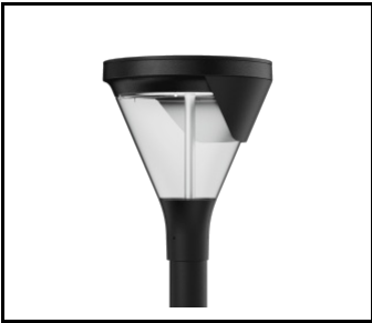
SKVER Backshield RAL9005 (435515)