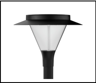
SKVER Reflektor Muster 1 RAL9005 (435522)