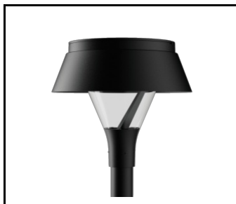
SKVER Hood ULR příklad 2 RAL9005 (421518)