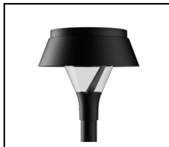
SKVER auvent ULR modèle 2 RAL9005 (421518)

Date de création de la carte: 18 décembre 2025