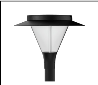
SKVER Reflektor Muster 1 RAL9005 (435522)