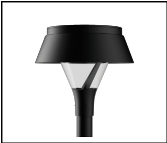
SKVER Reflektor ULR Muster 2 RAL9005 (421518)

Erstellungsdatum der Karte: 18 Dezember 2025 Der Hersteller behält sich das Recht vor, Produktverbesserungen und Designänderungen oder Modernisierung in den Produkten vorzunehmen. * Parametertoleranz beträgt +/- 10 %Das Produktdatenblatt ist kein kommerzielles Angebot.