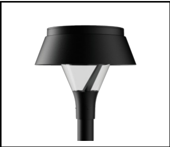
SKVER Reflektor ULR Muster 2 RAL9005 (421518)

Erstellungsdatum der Karte: 18 Dezember 2025