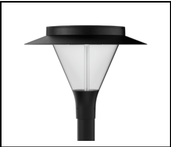
SKVER Reflektor Muster 1 RAL9005 (435522)