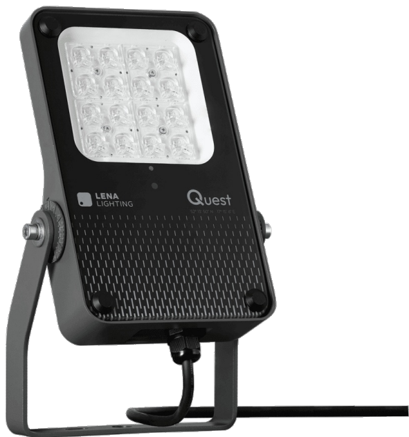
Zdjęcie poglądowe nie uwzględniające zawartych w zestawie uchwytów do montażu natynkowego. Overview photo not including the included surface-mount brackets.