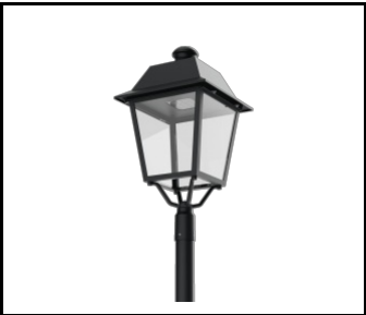
Constelia LED diffuseur transparent (809996)

Date de création de la carte: 09 juillet 2025