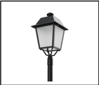
Constelia LED diffuseur dépolie (809989)