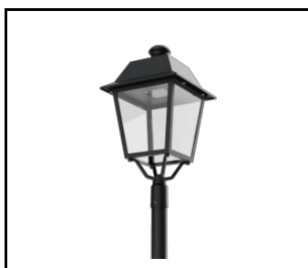
Constelia LED klosz transparentny (809996)