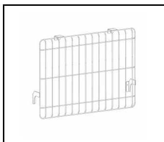
Grille de protection QUEST LED EVO M RAL7016 (840432)