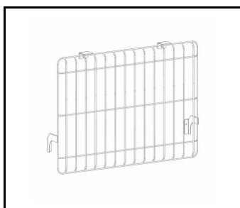
Grille de protection QUEST LED EVO M RAL9003 (840074)