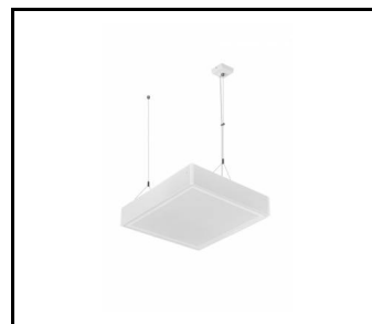
Závěsný systém CONTRA LED 600x600 (374685)