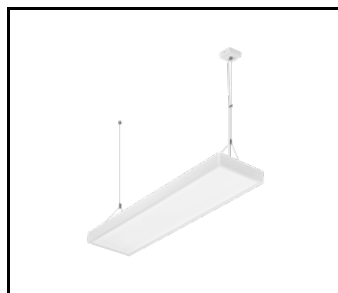
CONTRA LED závěsný systém 1200x300 (374692)