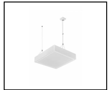
CONTRA LED-Pendelsystem 600x600 (374685)