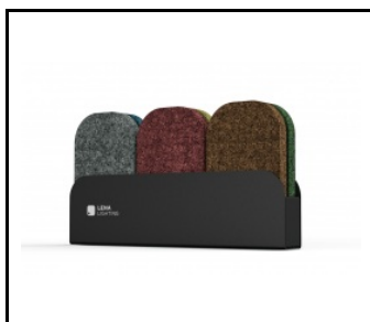
Terra Balance – Farbmuster der PET- Paneele (807015)