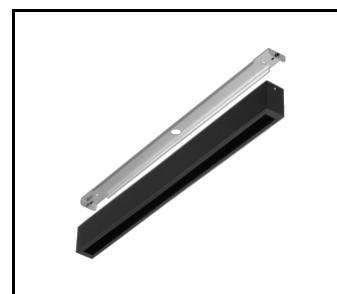
Terrano povrchový rám černý mat RAL9005 573x38x60 (420948)