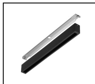
Terrano povrchový rám černý mat RAL9005 573x38x60 (420948)