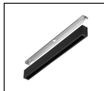
Terrano Oberfläche Rahmen schwarz matt RAL9005 573x38x60 (420948)