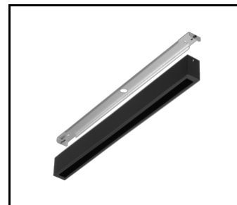
Terrano Oberfläche Rahmen schwarz matt RAL9005 573x38x60 (420948)