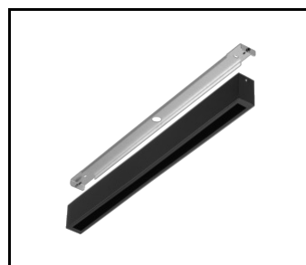
Terrano ramka natynkowa czarny mat RAL9005 573x38x60 (420948)