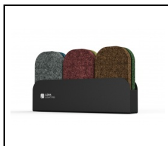
Terra Balance – vzorník barev panelů PET (807015)