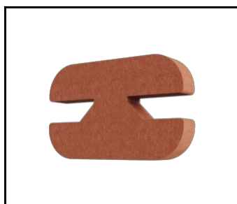
Sada konektorů Terra Balance 2 ks BRN01 (806957)