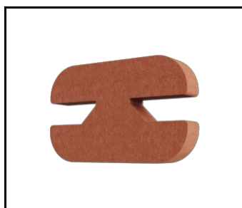
Jeu de connecteurs Terra Balance 2 pièces BRN01 (806957)