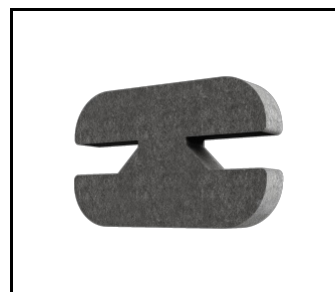
Jeu de connecteurs Terra Balance 2pcs GRAYM (806940)