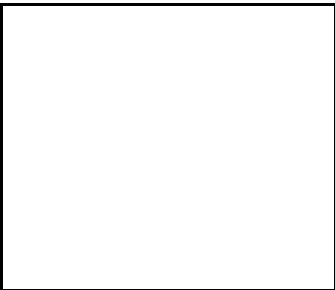
Terra Balance – Farbmuster der PET- Paneele (807015)

Erstellungsdatum der Karte: 18 April 2025 Der Hersteller behält sich das Recht vor, Produktverbesserungen und Designänderungen oder Modernisierung in den Produkten vorzunehmen. * Parametertoleranz beträgt +/- 10 %Das Produktdatenblatt ist kein kommerzielles Angebot.