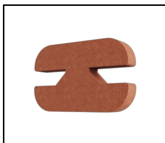
Terra Balance Steckerset 2 Stück BRN01 (806957)