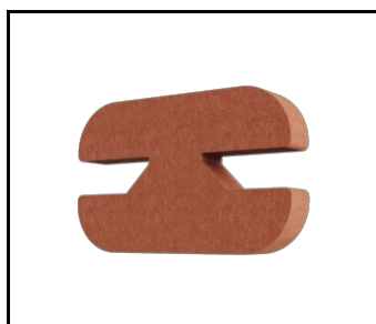
Terra Balance Steckerset 2 Stück BRN01 (806957)