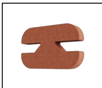
Zestaw łączników Terra Balance 2sztuki BRN01 (806957)