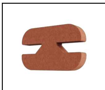
Zestaw łączników Terra Balance 2sztuki BRN01 (806957)