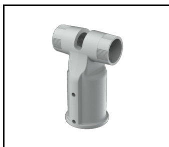
TIARA 2 LED Support réglable Dark Sky diamètre 64 mm gris (804625)