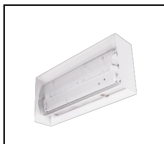
Schutzabdeckung für Orion LED-Leuchten (897191)