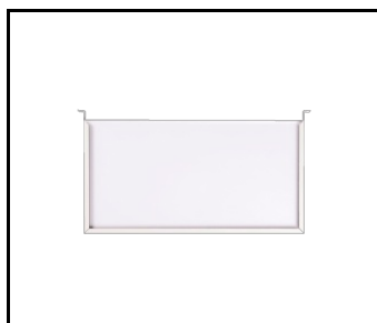
DS ORION LED II Doppelseitiger Rahmen (897214)

Erstellungsdatum der Karte: 18 Februar 2025