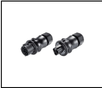
Tuba IP69K 3P connector set (778254)