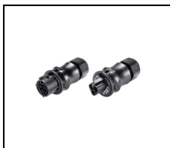
Tuba IP69K 3P connector set (778254)