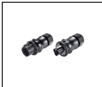
Tuba IP69K 3P connector set (778254)