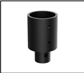
SKVER externer Adapter fi60 (804588)