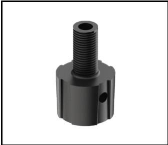
SKVER R Außengewindeadapter M20x40 (Steigung 2,5) (804427)