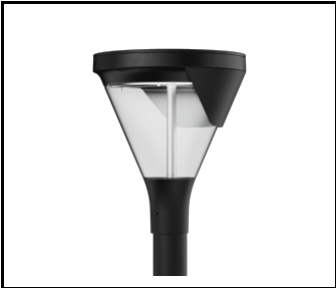
SKVER Backshield RAL9005 (435515)