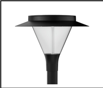
SKVER Reflektor Muster 1 RAL9005 (435522)