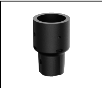
SKVER externer Adapter fi48 (804571)