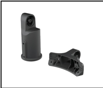
SKVER R Verstellbarer Griff Dark Sky schwarz (804618)